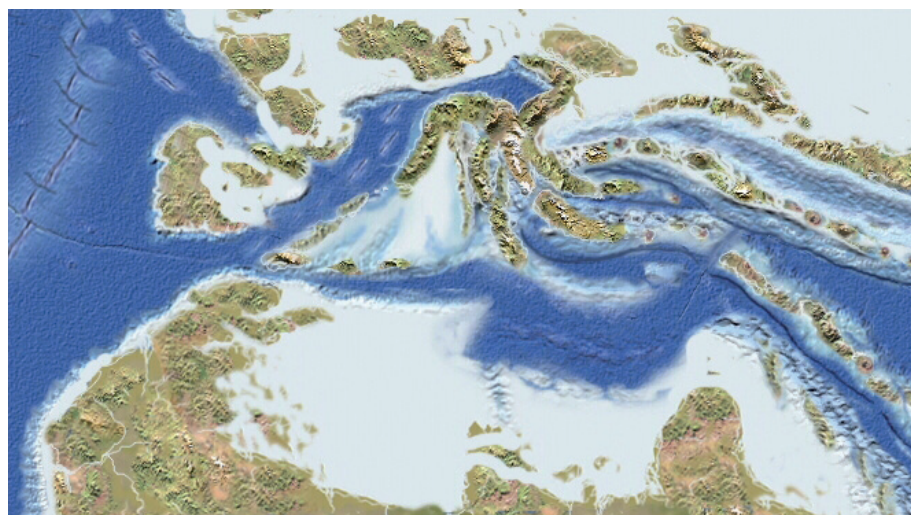
Cartina paleogeografica dell'area Mediterranea durante il Maastrichtiano e l'inizio del Cenozoico (secondo R. Blakey, www2.nau.edu/rc67/ ). Azzurro scuro: bacini oceanici; azzurro chiaro e bianco: mari poco profondi (epicontinentali). La stella indica la posizione del bacino di Hațeg (da Weishampel & Jianu, 2011).

minuziosa dei reperti fossili, caratteristica di tutti i lavori paleontologici di allora. Egli si poneva quesiti circa il modo di vita degli organismi estinti, l'anatomia delle loro parti che non si fossilizzano comunemente, la loro fisiologia, la loro ecologia e perfino sulla loro etologia. La sua vita ebbe una fine tragica. Nel 1933 Nopcsa si suicidò nel suo appartamento viennese dopo aver ucciso il suo autista.