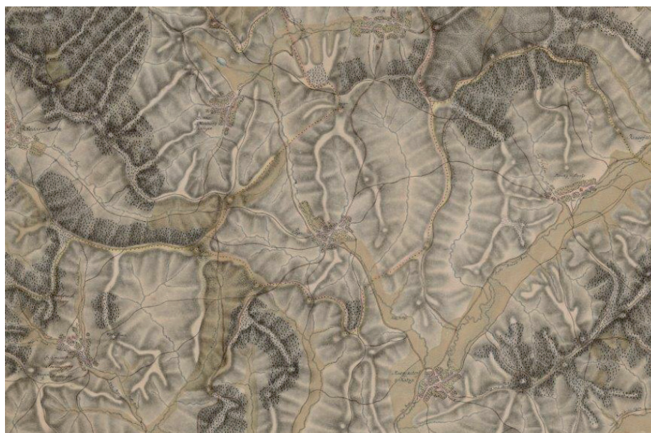
Fig. 1. Mappa storica dell'Impero Austro-ungarico, rilevata e montata negli anni 1869-1873. Archivio di Stato Austriaco, Archivi di guerra, B IX 715: originale Grossfürtenthums Transilvania.