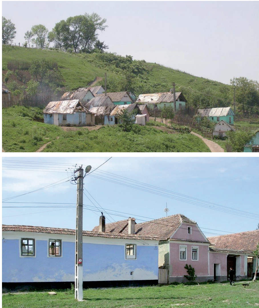
Fig. 5. Accampamento nomade vicino ad Alma Vii. Fig. 6. Cloasterf.

qualche anno di distanza, non resta più traccia dei restauri filologici avviati con notevole dispendio di energie. Nelle situazioni più estreme, i cantieri sono interrotti e ripresi secondo le disponibilità, con personale improvvisato senza controllo e protezione alcuna.