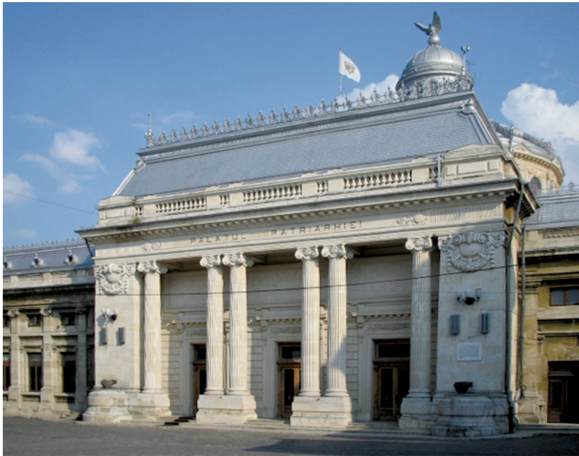
Palazzo della Patriarchia a Bucarest in cui nel gennaio 1859 Alexandru Ioan Cuza fu eletto principe di Valacchia. Poiché era stato già eletto principe di Moldavia, l'atto segnò l'unione di fatto dei due Principati romeni.

Di lì a pochi anni sarebbe stata fissata un'unica capitale, Bucarest, un unico Parlamento e istituzioni comuni. L'Impero ottomano si rassegnò ad accettare il fatto compiuto, pur con la clausola che la validità di quella unione fosse limitata alla sola persona del principe doppiamente eletto. Ormai il dado era però tratto. Deposto Cuza nel 1866, fu scelto un nuovo principe, il giovane Karl di Hohenzollern-Sigmaringen, che nel 1878 riuscì a ottenere la piena indipendenza del Paese, costituito in Regno nel 1881. Re Carol (questo il suo nome romenizzato) divenne così il primo sovrano del Regno di Romania che egli avrebbe governato a lungo, fino all'ottobre del 1914. Il suo successore, il nipote Ferdinand, avrebbe avuto il difficile compito di guidare la Romania attraverso la tempesta della Prima guerra mondiale, al cui termine, però, vi fu il compimento dello Stato nazionale nato nell'ormai lontano 1859 con la cosiddetta Mica Unire (Piccola Unione): la Marea Unire , la Grande Unione del dicembre 1918 grazie alla quale la Transilvania asburgica e altri territori entrarono a far parte del più esteso e popoloso Stato del Sud-est europeo.