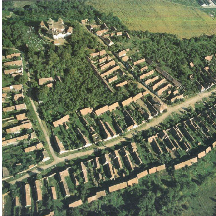
Fig. 2. Viscri (da G. Gerster, M. Rill, Siebenbürgen im Flug. Das deutsche Siedlungsgebiet: seine Kirchenburgen, Dörfer, Städte und Landschaften , Edition Wort und Welt, München, 1999).

Con l'ingresso della Romania nell'Unione Europea (2007), il fenomeno dello spopolamento di questi territori accompagnato da processi di emigrazione verso altri paesi europei non accenna a diminuire. Secondo alcune stime, la popolazione "sassone" di Transilvania, che nel 1930 contava 240.000 unità su un totale di 3.200.000 abitanti, non raggiungerebbe oggi le 20.000 unità, che condividono gli spazi insediativi con altre comunità scarsamente integrate: serbi, ungheresi, ucraini e romeni, e un imprecisato numero di rom. La principale concentrazione insediativa si trova all'interno della zona collinare tra Sibiu, Sighișoara e Fagaras, e due minori si attestano lungo gli storici confini della Transilvania ad oriente e settentrione, a riprova della funzione difensiva svolta dai villaggi agli inizi del secondo millennio.