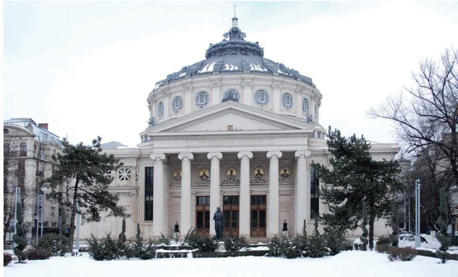
L'Ateneu român, forse il più noto edificio di Bucarest, fu costruito tra il 1886 e il 1888, in parte grazie a una sottoscrizione pubblica, lanciata con lo slogan: Dați un leu pentru Ateneu (Date un lei per l'Ateneo). È adibito ora a sala per concerti.