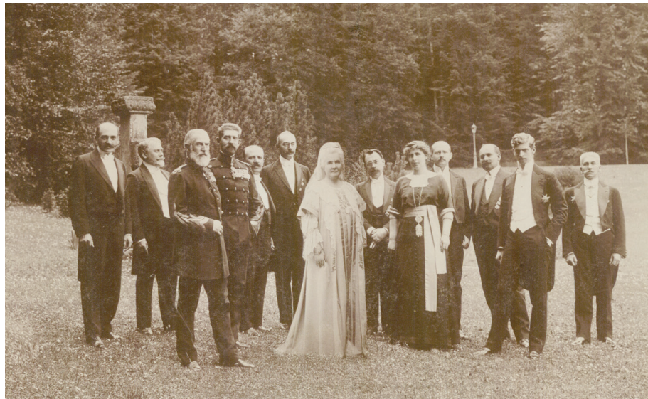
La famiglia reale romena, riunita in occasione del conseguimento del baccalaureato da parte del principe Carol (futuro Carol II), penultimo a destra. Al centro la madre, Maria di Sassonia Coburgo Gotha, e la regina Elisabetta di Wied (nota come scrittrice con il nome di Carmen Sylva). Terzo da sinistra il re Carol I e dietro di lui il nipote e futuro re Ferdinand, marito di Maria e padre di Carol II.