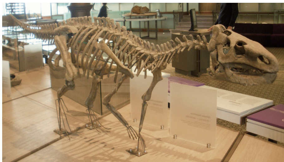
Scheletro del rhabdodontide Zalmoxes shqiperorum , montato al Museum Royal des Sciences Naturelles a Bruxelles.