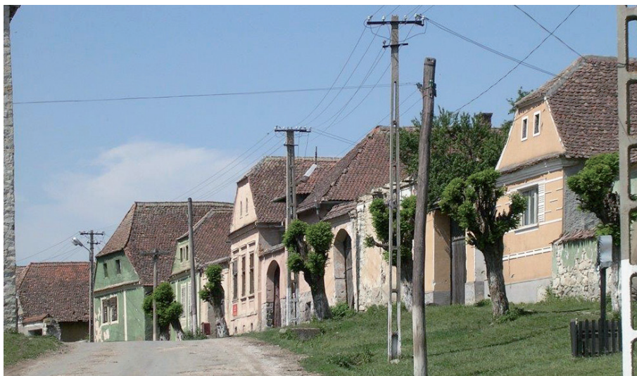
Figg. 3, 4. Roadeș.

memoria delle terre comuni che ogni villaggio conservava gelosamente a fronte degli appezzamenti attribuiti con sorteggio ai contadini e condotti seguendo cicli di rotazioni triennali.