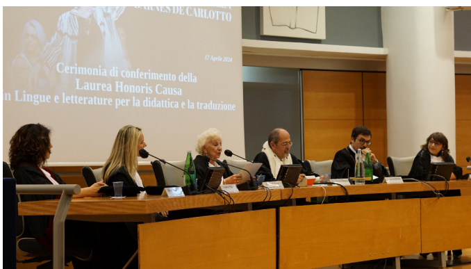
Enriqueta Estela Barnes de Carlotto legge la sua lectio magistralis

Il trascorrere dei mesi e degli anni ci convinse che non ci avrebbero restituito i nostri nipoti e che la nostra richiesta avrebbe dovuto resistere nel tempo, fino a che non li avremmo ritrovati tutti. Allora lasciammo le nostre routine per andare a reclamare i nostri figli e nipoti dentro e fuori il paese.